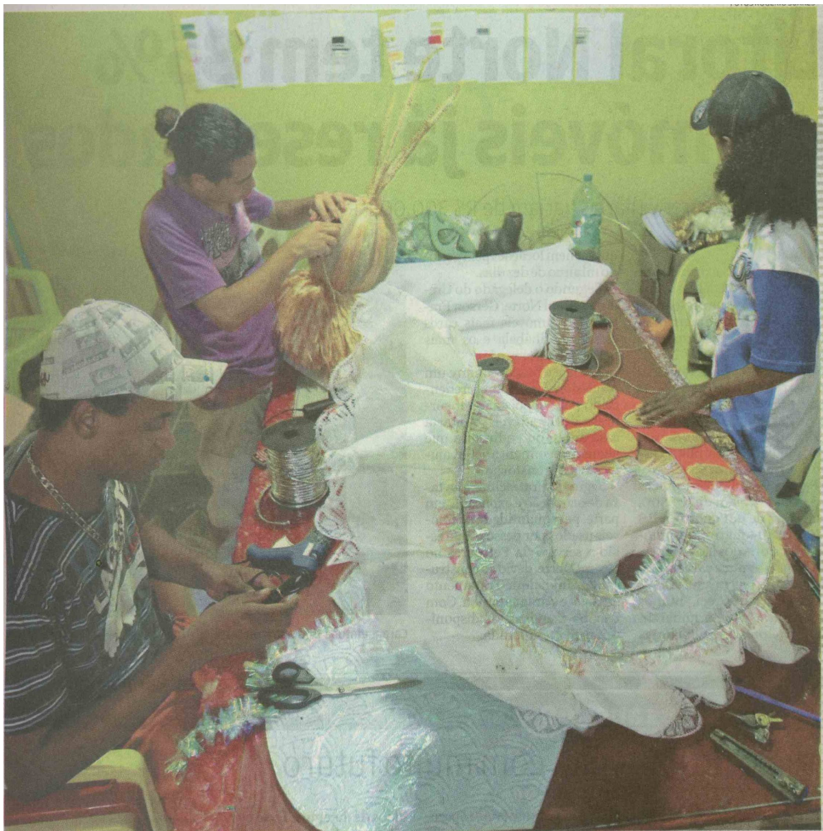
Componentes da Escola de Samba São Miguel trabalham na confecção das fantasias que serão exibidas na avenida, em março de 2011